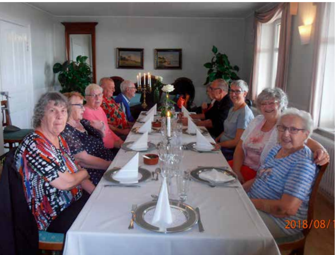
Besøg fra Kolding Harmonikaklub

Seest Menighedsråd har gennem alle årene støttet os økonomisk, så vi kunne få oplevelser i nærområdet. Desuden er det lykkedes via Kolding Kommune at søge § 79 midler, hvilket vi kommer på en minitur for hvert år. I år 2018 såvel som i år 2019 er det også lykkedes af få bevilling fra Seniorpuljen ved Kolding Kommune, som beboerne fra Caféen har fået en lidt længere tur for. I marts 2019 var de således på VADEHAVSCENTRET m/GUIDE, og efterfølgende på BRØNS KRO til middag.