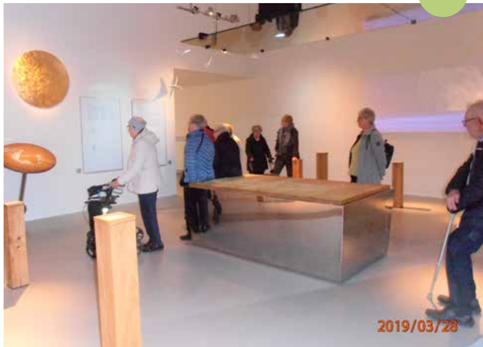
Besøg på Vadehavsmusset